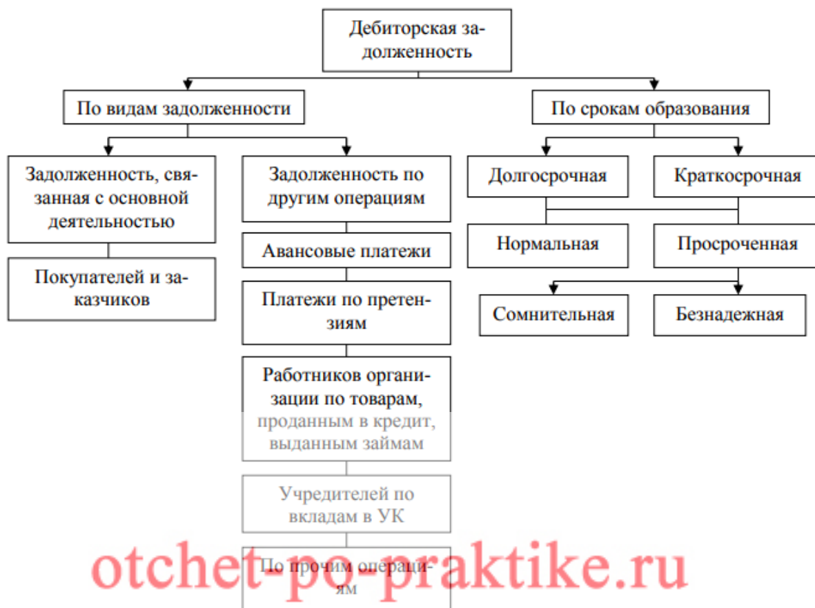
Рисунок 1 – Структура дебиторской задолженности